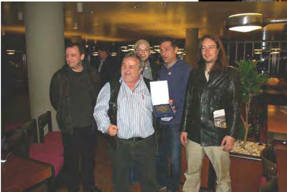
Links: Siegerehrung. TT/Wiheil ist Berliner Mannschafts- Meister 2008/09