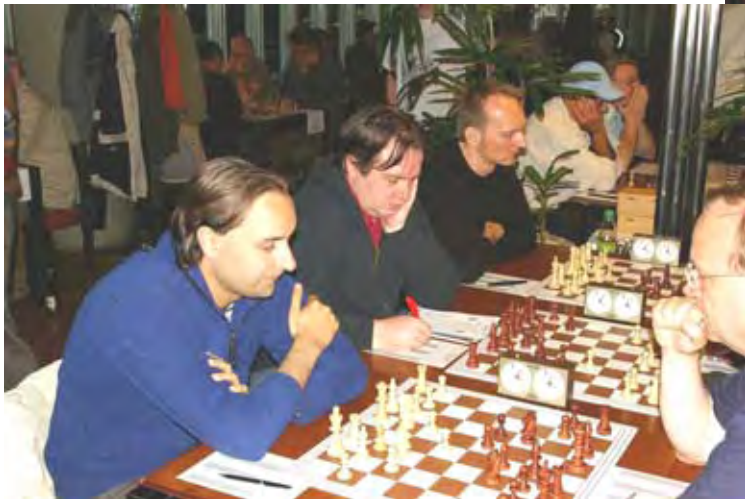
Links: LL, BA Tempelhof – Osram