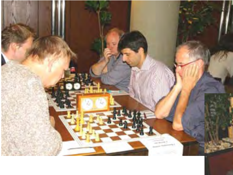
Links und unten: Abstiegskampf in der Landesliga: SG Bund gegen Bayer-Schering-Pharma..