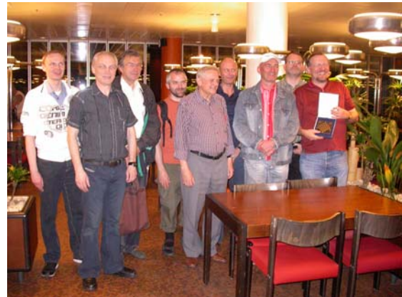
Der neue Berliner Mannschaftsmeister Deutsche Bahn/BSW nach der Preisverleihung.

45.h5 ♗g4 46.hxg6 hxg6 47.♚f4 ♗f5 48.g4 ♗b1 49.d6 ♚d8 50.♚g5 f6 51.♚c1 ♗d3 52.♗d5+ ♘g7 53.♚e3 ♗c2 54.g5 ♗f5 55.dxe7 1-0