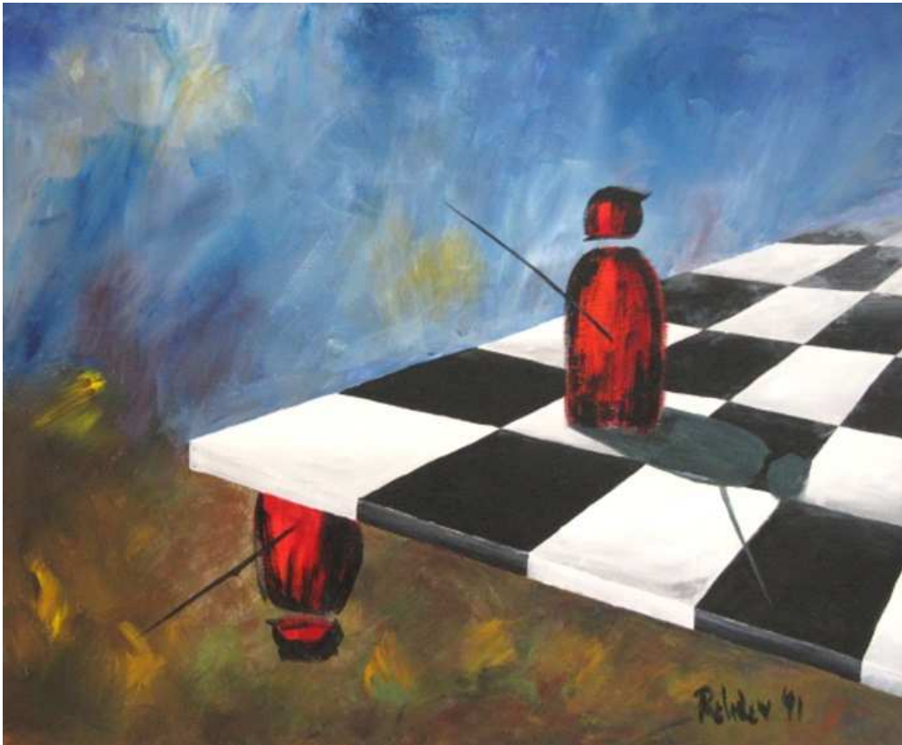
Ölbild: Elke Rehder